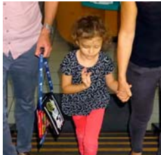
APPUI AU DIAGNOSTIC